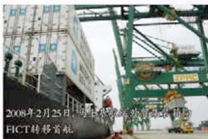
2008年2月25日，马士基航运外贸集装箱FICT转移首航

随着福州港外贸集装箱航线转移的进行，马士基航运将视具体条件最早在FICT开辟新的海运干线，为福州外贸经济发展提供更好的运输渠道。