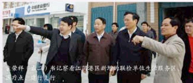
袁荣祥（第二）书记察看江阴港区新增的联检单位生活服务区建设点，进行调研。

2008年3月5日，福州市委书记袁荣祥带领市直有关部门负责人赴福清市调研经济工作，察看了江阴港区口岸园区、保税物流园区、FICT停车场、加油站、客运站、联检单位生活服务区等项目。